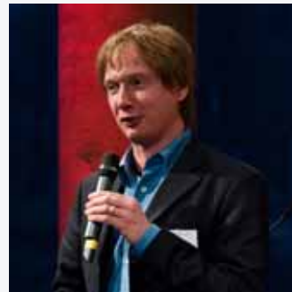
Moderation: Holger Beckmann , WDR